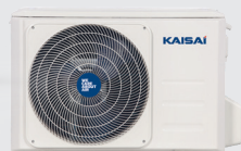
Jednostka zewnętrzna KSH